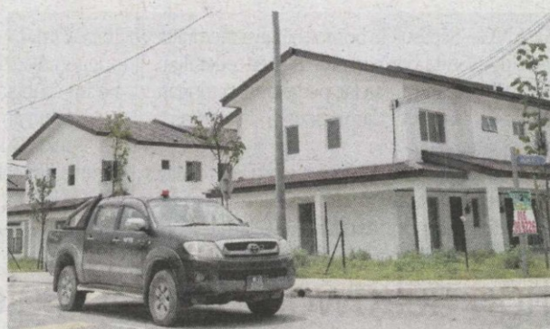
Penduduk mula berpindah masuk secara berperingkat sejak April lalu.

"Penyerahan kunci dibuat April lalu kepada penduduk yang layak dan terdapat beberapa penduduk menghadapi