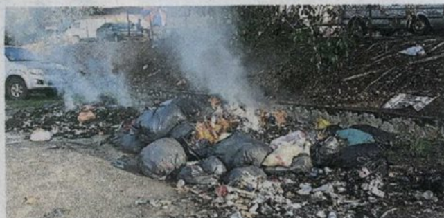
■巴刹后门小路的垃圾越堆越多，又遭人焚烧，已严重污染周遭的环境。

居民投诉美嘉花园20路为尽头路，也是垃圾满地，一袋袋的工厂废料被弃置在草丛旁，又有被焚烧过的痕迹，影响附近组屋居民的生活。