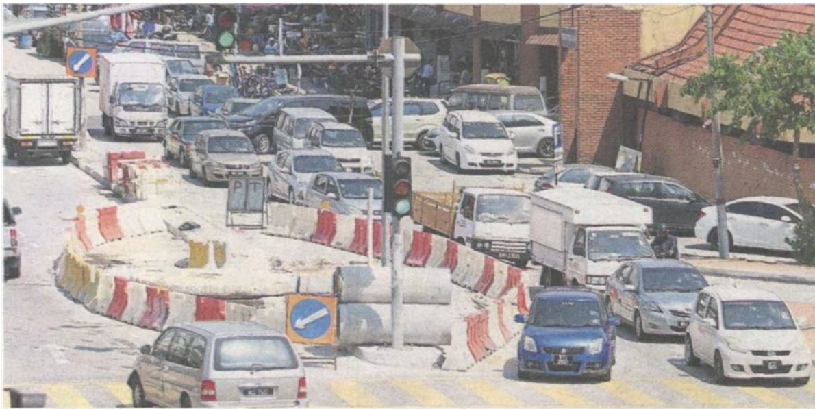
One of the sewerage project sites in Petaling Jaya Old Town beside Pasar Jalan Othman.