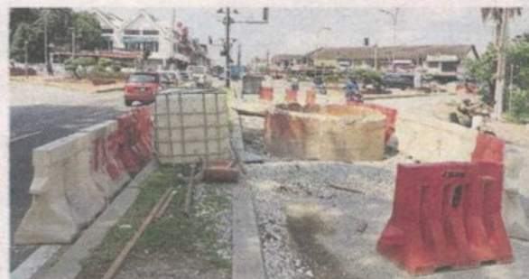
A concrete cylinder has been fitted on the shaft in Petaling Jaya Old Town to prevent vehicles from plunging in.