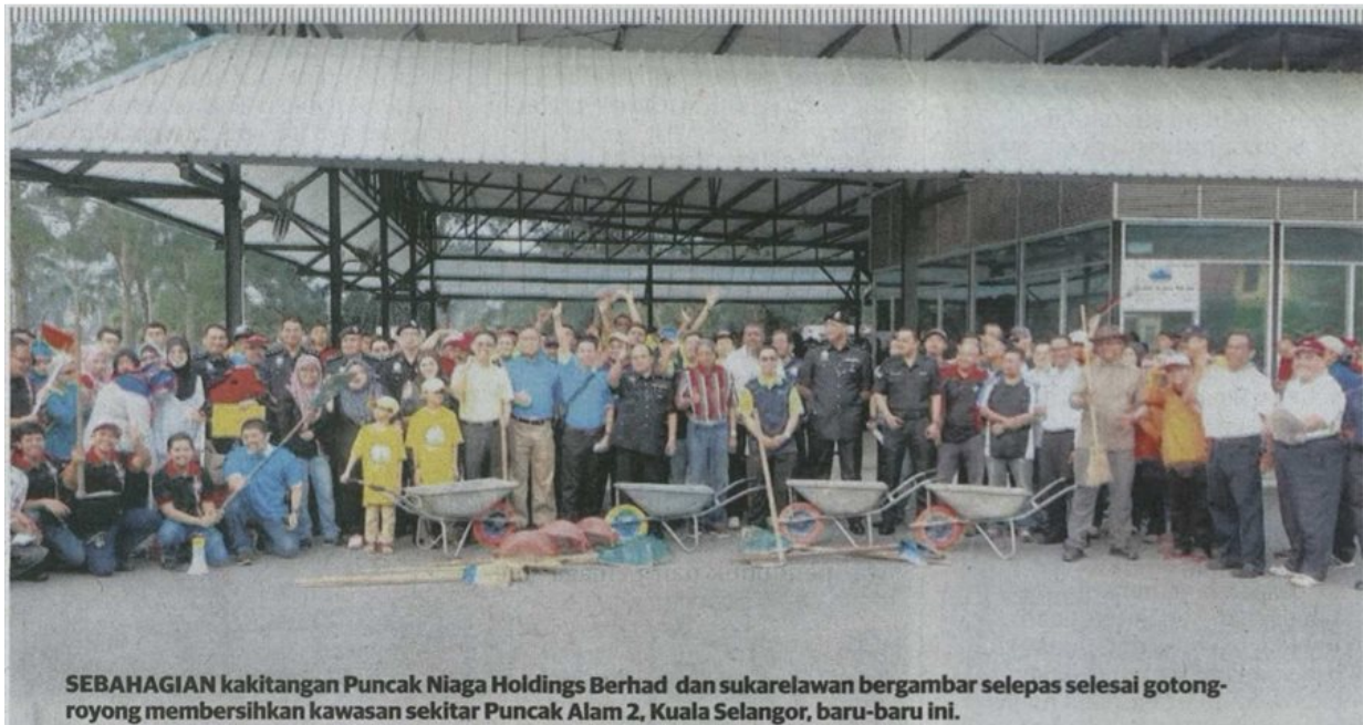
SEBAHAGIAN kakitangan Puncak Niaga Holdings Berhad dan sukarelawan bergambar selepas selesai gotong-royong membersihkan kawasan sekitar Puncak Alam 2, Kuala Selangor, baru-baru ini.