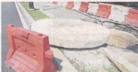
The concrete slab used to cover the sewer shaft in Petaling Jaya Old Town.