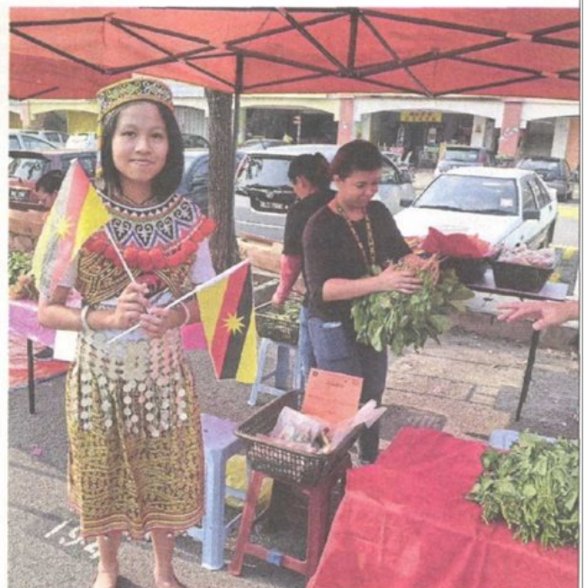
A girl dresses up semi traditionally in her Iban costume on the first day of the Pasar Borneo.

"There's no space for them to sell their wares, but we knew about this space. It's empty on Saturday morning and there's plenty of parking space," said Ong.